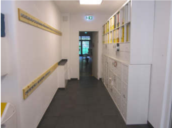
Toiletten (hinterer Bereich)